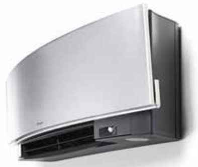
Flüsterleise mit nur 19 dB(A)

Der Intelligente Bewegungssensor für 2 Bereiche regelt den Komfort auf zwei Arten. Bei Verlassen des Raumes für mehr als 20 Minuten schaltet das Gerät automatisch in den Energiesparmodus. Sobald der Raum betreten wird, wird der ursprüngliche Betrieb erneut aktiviert. Der Intelligente Bewegungssensor leitet den Luftstrom von Personen weg, um unangenehme Zugluft zu vermeiden.