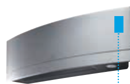
Daikin Emura wird serienmäßig* mit einem integrierten WiFi-Adapter geliefert

Ermitteln: Räume in Ihrem Haus für einfache Regelung des entsprechenden Geräts